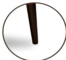
GL available in: