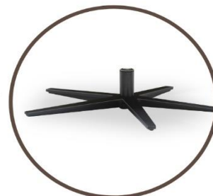
leg black or RVS