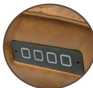
controlpanel black or RVS

HEIGHT: 114 cm DEPTH: 87 cm DEPTH FLAT POSITION: 168 cm WIDTH: 72 cm SEAT DEPTH: 49 cm SEAT HEIGHT: 46 cm ARM HEIGHT: 67 cm