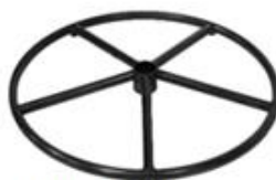
E) STER ROND E1) STER ROND ZWART