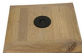
J) VOET HOUT J1) VOET HOUT ZWART