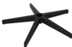
B) 5 TEENS ZWART