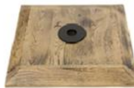
M) VOET HOUT GEBRAND