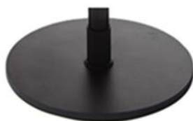
G) SCHIJF ROND ZWART