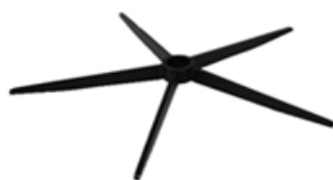
A) STERVOET ZWART