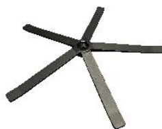
N) STER PLAT