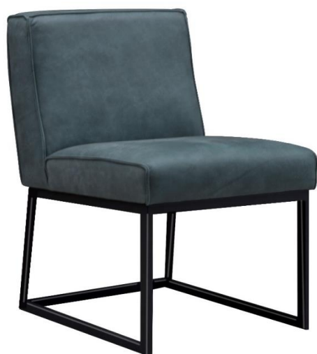
eetkamer- / project-stoel